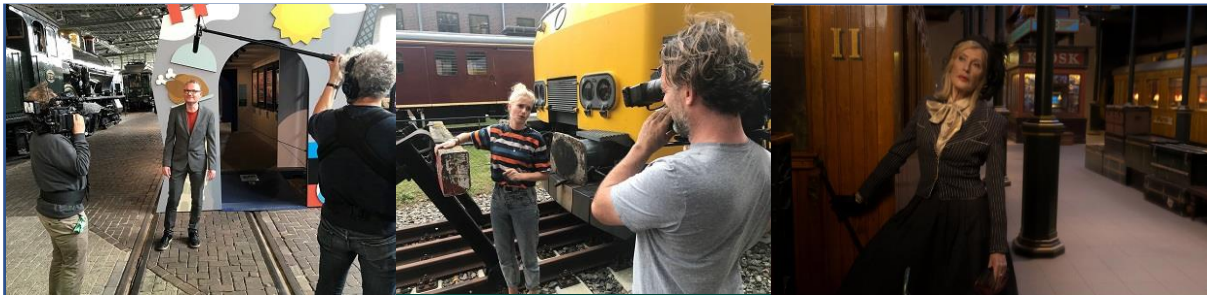
Opnamen voor (van links naar rechts) Andere Tijden , Klokhuis en Het Perfecte Plaatje