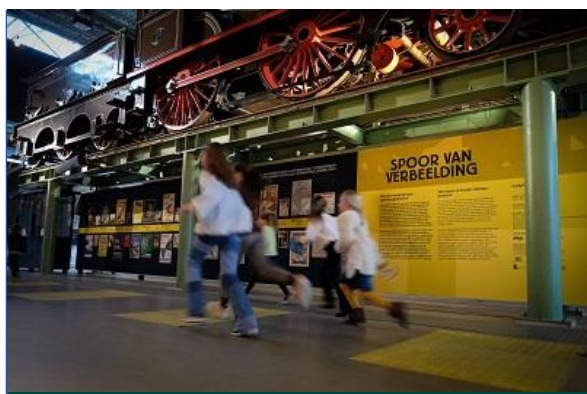
Op 5 juni was het eindelijk zover, het museum en de tentoonstelling gingen open.

De tentoonstelling werd feestelijk geopend met een speciale online-uitzending gepresenteerd door voormalig RTV Utrecht presentatrice Eva Brouwer. De tentoonstelling werd verlengd, de affiches waren tot en met 21 november 2021 te zien in het Spoorwegmuseum. Dank gaat uit naar bruikleengevers: Steendrukmuseum Valkenswaard, Design Museum Huis Dedel, Reclame Arsenaal, Zeeuws Archief en het Deutsches Plakat Museum/Museum Folkwang Essen.