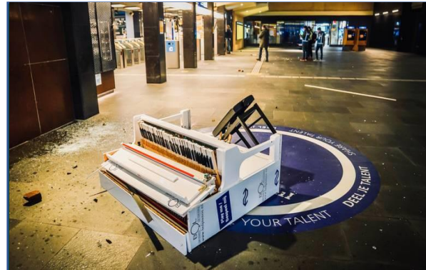
De vernielde piano op station Eindhoven CS