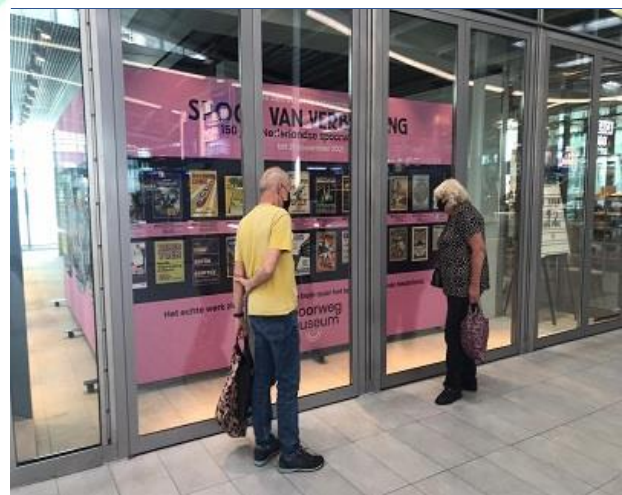
Wachtende reizigers op Utrecht CS krijgen een preview van de tentoonstelling Spoor van Verbeelding.

Op Utrecht CS staan regelmatig winkelpanden leeg. Omdat dit geen leuke aanblik is voor de passanten heeft NS Stations het Spoorwegmuseum aangeboden een van deze ruimtes aan te kleden. Vanaf begin augustus stond er daarom bij de roltrappen van Spoor 14-15 een mooie banner van de tentoonstelling Spoor van Verbeelding. De inrichting is mede mogelijk gemaakt dankzij een bijdrage van het Ondernemersfonds Utrecht.