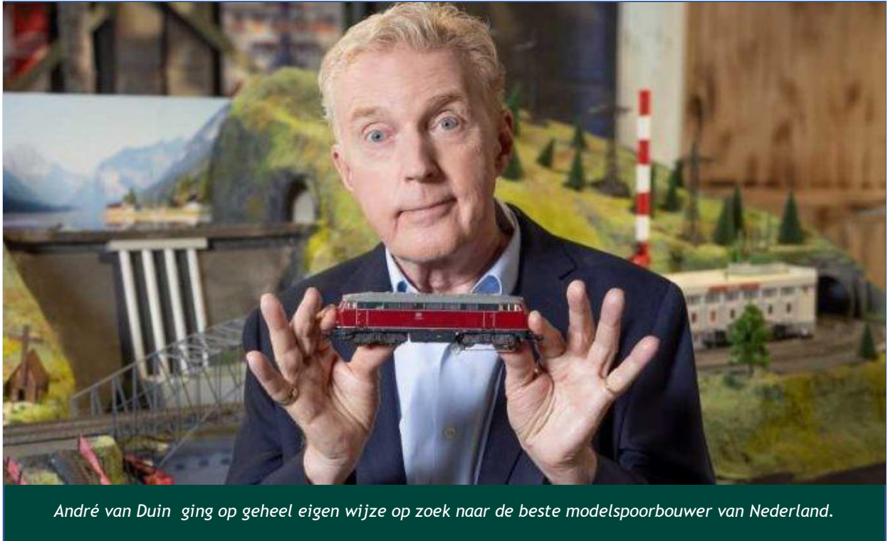
André van Duin ging op geheel eigen wijze op zoek naar de beste modelspoorbouwer van Nederland.