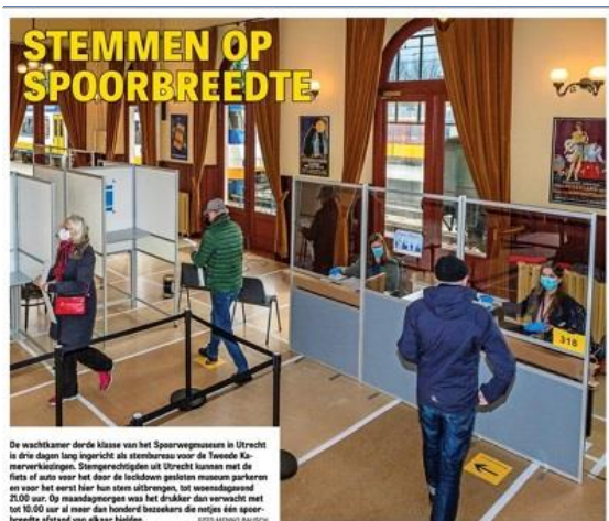
Telegraaf 16 maart 2021