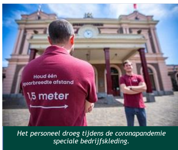
Het personeel droeg tijdens de coronapandemie speciale bedrijfskleding.

De eerste maanden van het jaar bleef het Spoorwegmuseum vanwege de coronalockdown gesloten. Daar kwam in april voor korte tijd verandering in. In het weekend van 23 t/m 25 april kon het museum voor heel even zijn deuren openen voor een sneltestpilot. De pilot was onderdeel van het plan waarmee het Ministerie van OCW de inzet wilde onderzoeken van sneltesten in de culturele sector. In deze drie dagen bezochten 2.300 museumkaarthouders het Spoorwegmuseum. Het was erg fijn om even weer bezoekers te kunnen ontvangen.