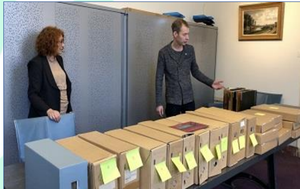
Het Tweede Wereldoorlog archief tijdens de overdracht aan Het Utrechts Archief.

Het Spoorwegmuseum ontving in het kader van 75 jaar Vrijheid een bijdrage van het Mondriaan Fonds, speciaal voor het registreren, digitaliseren en publiceren van de deelcollectie Tweede Wereldoorlog. Dit project, lopend in 2021 en 2022 met als titel Beladen jaren in beeld , omvat vooral foto's, maar ook andere belangwekkende documenten en literatuur. Het papieren archief verhuisde naar Het Utrechts Archief waar het wordt onderzocht, geconserveerd en toegankelijk gemaakt. De fotocollectie blijft bij het Spoorwegmuseum en wordt geregistreerd en gedigitaliseerd.