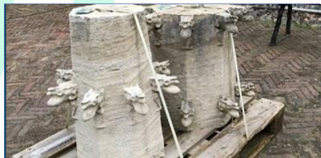
Twee stukjes Domtoren zijn te zien in het Spoorwegmuseum.

Vanwege het 700-jarig bestaan van de Domtoren zijn er door de stad Utrecht stukken Domtoren verspreid, zo is ook in het Spoorwegmuseum een stukje Domtoren te zien. Het ornament is een pinakelschacht, het onderste deel van een pinakel. Pinakels vormen de bekroning van verticale bouwdelen (1901-1931). Op 26 juni 1321 is de eerste steen gelegd en 700 jaar later viert Utrecht dit jubileum op feestelijke wijze en zijn er ornamenten verspreid door de stad.