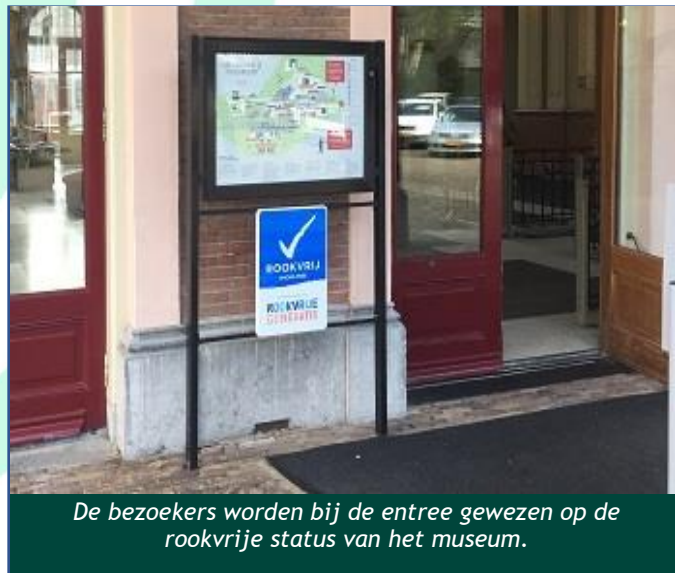
De bezoekers worden bij de entree gewezen op de rookvrije status van het museum.

Het Spoorwegmuseum is aangesloten bij de Rookvrije Culturele Alliantie , een stadsbreed initiatief van de gemeente Utrecht waarbij culturele instellingen tegelijk aankondigen rookvrij te worden en zo een bijdrage te leveren aan de rookvrije generatie. Sinds 6 september 2021 is het Spoorwegmuseum tijdens reguliere openingsuren rookvrij.