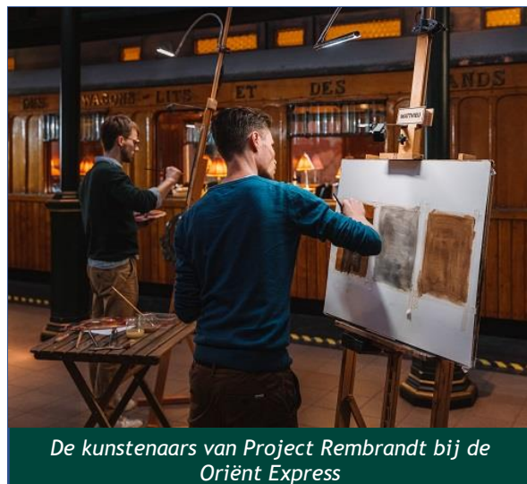
De kunstenaars van Project Rembrandt bij de Oriënt Express

Ook het schoolbezoek had te lijden onder de coronabeperkingen. De eerste maanden van het jaar was het museum gesloten waardoor we geen scholen konden ontvangen. Door de onzekerheden rond de coronamaatregelen, en het hoge aantal besmettingen onder leerlingen, bleven de schoolbezoeken ook in het najaar achter bij het gemiddelde. Op het moment dat scholen weer mogelijkheden hadden om op pad te gaan wisten ze ons goed te vinden.