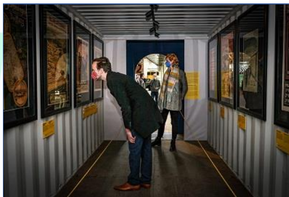
De lichtgevoelige affiches hingen in containers om ze niet te veel bloot te stellen aan daglicht