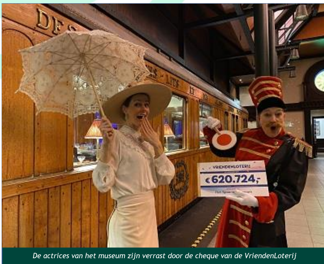
De actrices van het museum zijn verrast door de cheque van de VriendenLoterij