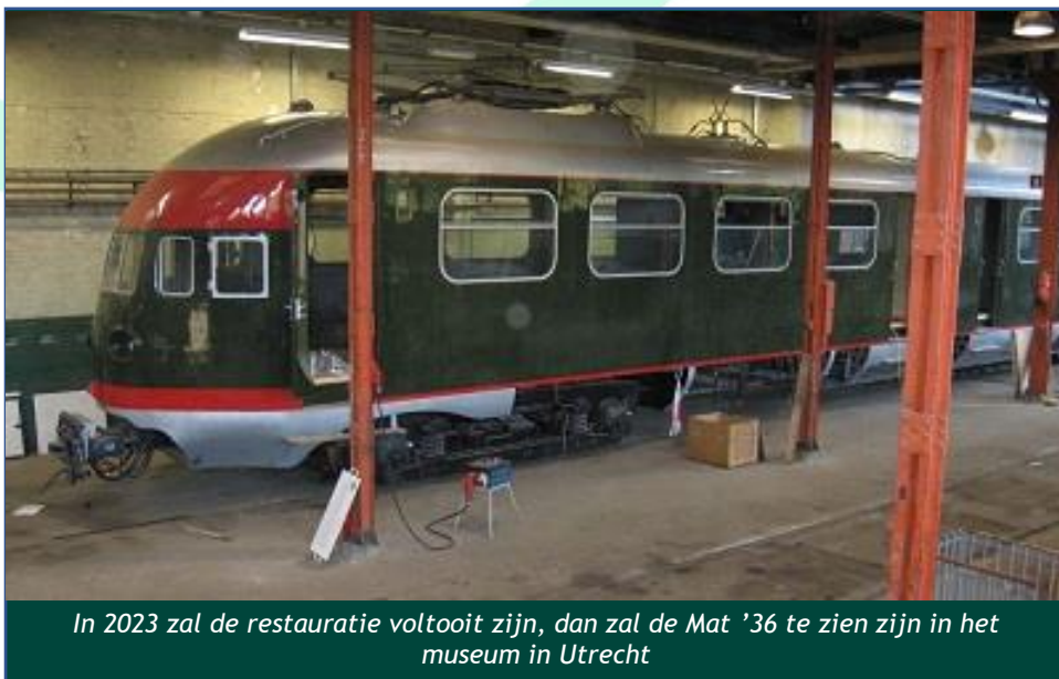
In 2023 zal de restauratie voltooid zijn, dan zal de Mat '36 te zien zijn in het museum in Utrecht

Er wordt hard gewerkt aan de restauratie van treinstel Mat'36 252. Deze trein uit 1938 staat al geruime tijd als geconserveerd casco in depot Blerick. Hier wordt door een enthousiast team vrijwilligers hard gewerkt aan het herstel van het volledige interieur, een enorme arbeidsintensieve klus. Hierbij moet er gedacht worden aan het terugplaatsen van alle houten panelen, sierlijsten, plafondplaten, banken en de cabines. Parallel aan deze activiteiten moeten alle relevante technische zaken aangebracht worden, bijvoorbeeld de complete verlichting. In het voorjaar is een tweede team in Utrecht gestart met het herstel van alle technische apparatenkasten die onder deze trein geplaatst moeten worden. De gehele hoogspanningsschakelinstallatie moet opnieuw worden opgebouwd. Revisie van de schakelaars wordt door enthousiaste vrijwilligers gedaan. Dit werk wordt in het fietsenrijtuig in het museum uitgevoerd en kan gevolgd worden door bezoekers van het museum. In 2023 zal de restauratie voltooid zijn, dan zal de Mat '36 te zien zijn in het museum in Utrecht.