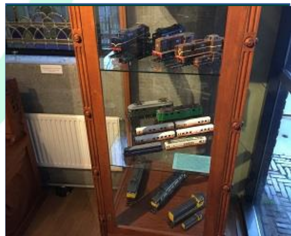
De collectie modellen van Arthur Wosniak is te zien in een vitrine in het museum.