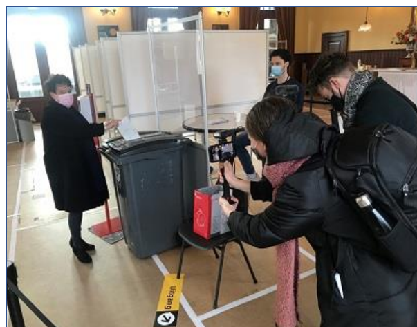
Burgemeester Dijksma bracht haar stem uit in het Spoorwegmuseum.

Op 15, 16 en 17 maart was Wachtkamer 3 de klasse stemlocatie voor de Tweede Kamerverkiezingen. In totaal brachten 4.225 Utrechters, verspreid over 3 dagen, hun stem uit in het Spoorwegmuseum. De bijzondere stemlocatie bracht veel media-aandacht met zich mee. De Telegraaf koos het Spoorwegmuseum als locatie voor een paginagrote foto over het museum als stembureau, de 5 Uur Show en RTL Nieuws kwamen voor een reportage. Burgemeester Sharon Dijksma koos voor het Spoorwegmuseum als locatie om haar stem uit te brengen.