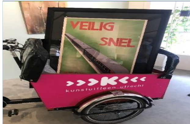
De affiches waren echte eyecatchers en daardoor snel uitgeleend

De affiches die in de tentoonstelling 'Spoor van Verbeelding' hingen waren niet te koop in de winkel. Door een samenwerking met de Kunstuitleen Utrecht gaf het museum liefhebbers toch de kans zo'n mooi affiche thuis aan de muur te hebben. De Kunstuitleen selecteerde tien affiches die via de Pop Up Store op de Twijnstraat te leen waren.