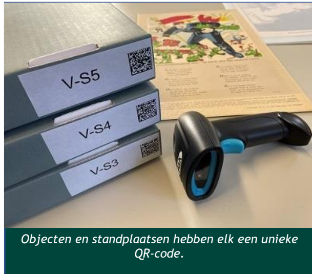
Objecten en standplaatsen hebben elk een unieke QR-code.

Wat direct van belang is voor de werkzaamheden van de Registratiefabriek is het toekennen van standplaatsen aan objecten door middel van QR-code scanning. Groot verschil met vroegere collectiebeheerpraktijk is dat het standplaatsen van collectie hiermee sneller, foutlozer en daardoor consequenter gaat. Opruiming en herstructurering van de depots gebeurt ook binnen het Registratiefabriek project, met als resultaat overzichtelijke en opgeschoonde depotruimtes.