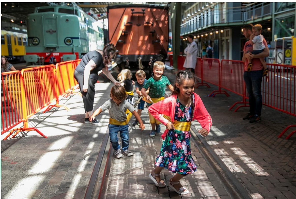
Het populairste onderdeel van Techlab XL: trein trekken

Dit evenement, dat in 2019 nog in de zomervakantie was geprogrammeerd, verhuisde in 2021 naar de herfstvakantie. Door de ruime opzet kon Techlab XL binnen de toen geldende coronaregels prima doorgang vinden. Dankzij een grote tent op het achterterrein, waar bezoekers bij een aantal werkstations al doende de techniek achter de trein kunnen ontdekken, had iedereen genoeg ruimte om 1,5 meter afstand te bewaren. Mede dankzij Techlab XL mocht het Spoorwegmuseum in de herfstvakantie een bezoekersaantal van 27.500 noteren.